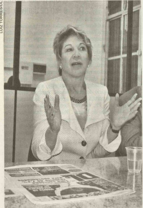
Em companhia de parlamentares petistas, a pré-candidata do PT ao Senado visitou na manhã de ontem a sede do Diário do Litoral